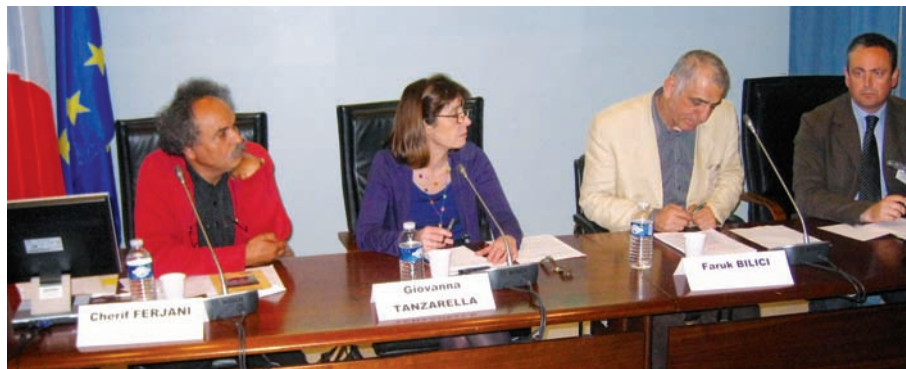
2ème table ronde : Tunisie et Turquie

Si ces Rencontres ont été un bon cru, nous sommes déjà en route vers les 3èmes qui se dérouleront les 24 et 25 novembre 2011. C'est grâce à vous que la fréquentation a augmenté. Il faut maintenir notre effort. Nous envisageons de réviser les tarifs un peu à la baisse, nous vous en informons très vite, mais il est certain que ce type de rencontres nécessite des moyens financiers (voyages, hébergement, restauration de nos invités..) que le mécénat ne peut pas couvrir complètement.