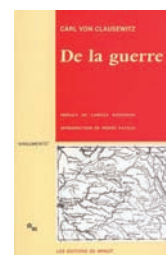
CARL VON CLAUSEWITZ De la guerre Arguments LES ÉDITIONS DE MINUIT