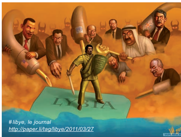
# libye, le journal http://paper.li/tag/libye/2011/03/27

La valse hésitation du Prix Nobel de la Paix pour engager son pays dans l'action n'a pas aidé. Or il va sans dire que sans les Américains, personne n'y serait allé. Ou peu s'en faut. Le 25 mars, contre l'avis