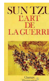
SUN TZU L'art de la guerre Champs FLAMMARION

3 - France, Etats-Unis, Allemagne, Italie, Royaume-Uni, Russie